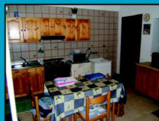
SA-Ogliara Soluz. indep. di 115mq. su 2liv., al 1°liv.ingr., sog. con camino, cucina, cam.matrim., cam., bagno, ripost.; 2°liv.c.matrim., bagno, terrazzo di 15mq cantina, box doppio. Ottimo rifin. € 310.000 Rep. 1064177