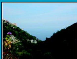
Vietri Centro Monolocale composto da camera da letto, angolo cottura, bagno. Discrete condizioni. Ideale per investimento. € 110.000,00 Replat 1066384