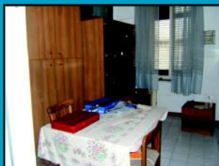
Vietri- Marina A pochi passi dal mare biloc.composto da soggiorno, cam. da letto, bagno. Ideale per le vacanze € 190.000,00 Replat 1057845