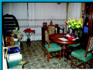
Vietri Centro In stabile signorile luminoso appart. di 100mq: ampio ingresso, 2cam.letto, salone, cucina, 2bagni, ripost. Ottimo rifin. balconi vista mare € 650.000,00 Replat 1057028